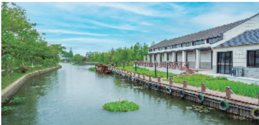
大齐塘村玉泉村落

日前，星光社区已完成设计招标和施工招标，正紧锣密鼓开工建设。此轮农房建设共152户，其中100㎡户型104户、80㎡户型48户，总投资约1亿元，全部采用统建模式。 今年新埭镇农建规模很大，不光要建设未来农村新社区，还有公寓房和自然村落保留点的农房翻建。农村建筑工匠数量有限、能力也有限，如何能建设出既能满足江南水乡民居风貌又符合现代生活功能需求的农房？新埭镇践行“四敢争先”精神，探索实施农房统