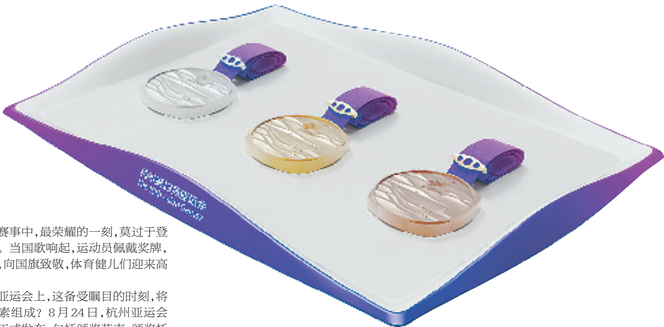
杭州亚运会颁奖托盘设计。

体育赛事中,最荣耀的一刻,莫过于登上领奖台。当国歌响起,运动员佩戴奖牌,手捧花束,向国旗致敬,体育健儿们迎来高光时刻。