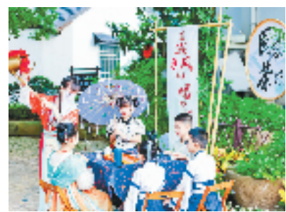
图为国风少年在安吉县鄞吴镇的研学之旅。

8月18日，浙里昌硕·寻迹鄞吴，2023安吉鄞吴第五届亲子(研学)旅游节在湖州安吉县鄞吴镇开幕。当天，来自全国各地的亲子家庭在鄞吴镇鄞吴村文化礼堂内制作精美竹扇，在修谱大屋体验活字印刷技艺，