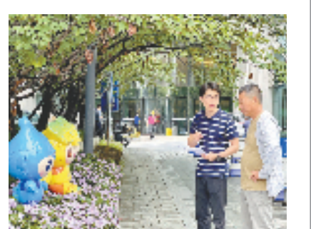
年轻干部指导亚保酒店提升工作

“接下来,我们会继续把护航亚运作为深化开展‘扛旗争先 金靴奔跑’干部大比拼的重要载体,放大亚运综合效应,以服务保障亚运的实效检验年轻干部淬火提能的成效。”上城区委组织部相关负责人说。