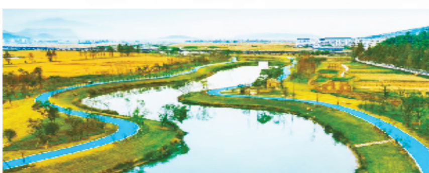
瑞安市曹村镇田园风光

根据今年6月出台的《温州市城镇社区公共服务设施补短板行动方案（2023—2025年）》，到2025年底，温州市城镇社区公共服务设施体系更加完