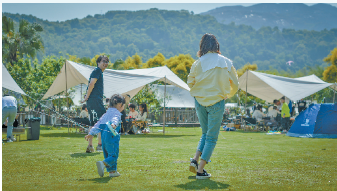
东篱下生态休闲农庄

在永中街道,一个个新乡贤助力乡村振兴的故事,成为当地村民的美谈。为大力开展“乡贤+产业发展”行动,永