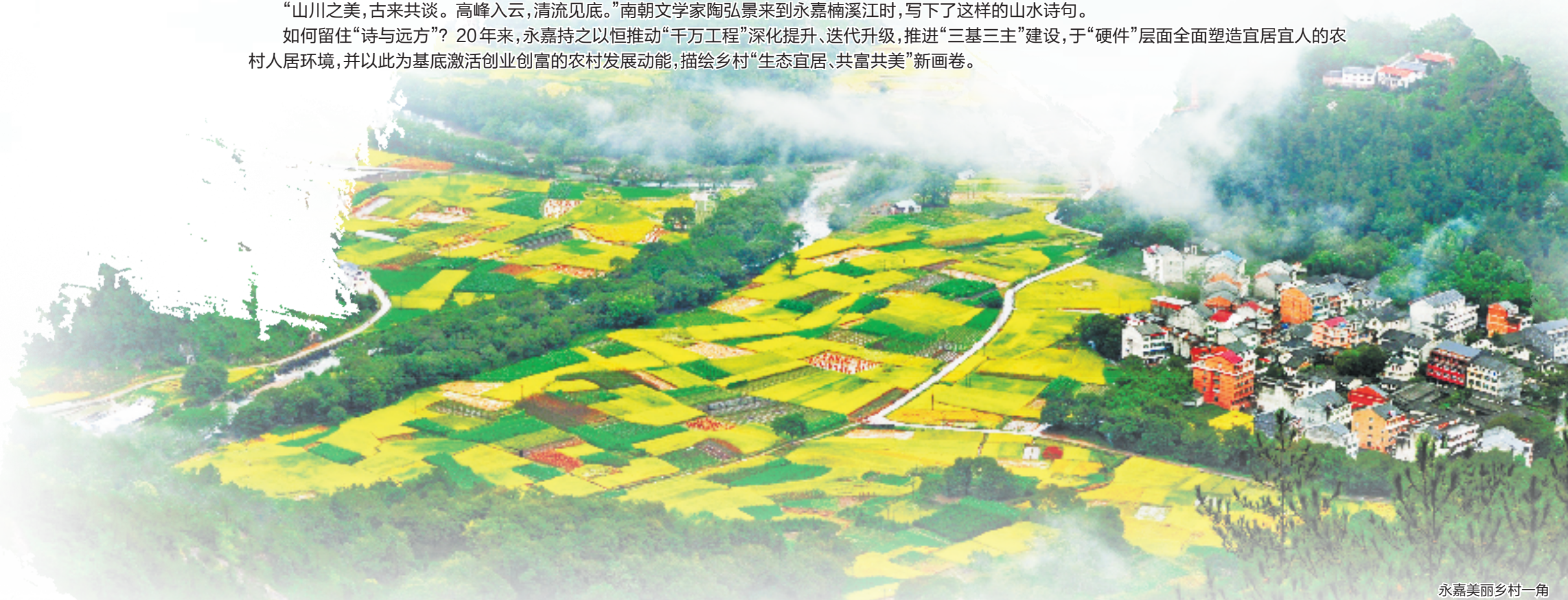
永嘉美丽乡村一角

“山川之美，古来共谈。高峰入云，清流见底。”南朝文学家陶弘景来到永嘉楠溪江时，写下了这样的山水诗句。如何留住“诗与远方”？20年来，永嘉持之以恒推动“千万工程”深化提升、迭代升级，推进“三基三主”建设，于“硬件”层面全面塑造宜居宜人的农村人居环境，并以此为基础激活创业创富的农村发展动能，描绘乡村“生态宜居、共富共美”新画卷。