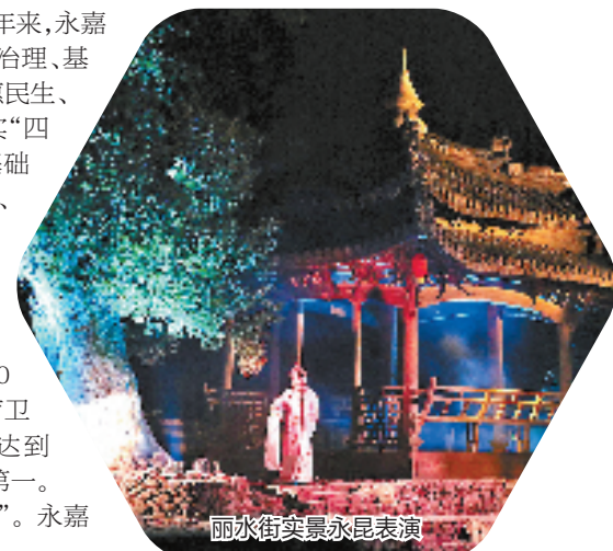
丽水街夜景永昆表演