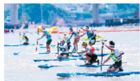
2023年绿水青山中国休闲运动挑战赛(温州洞头站)吸引了全国多地选手参与。