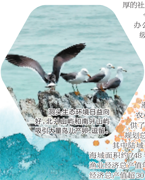
洞头生态环境日益向好,北岸山屿和南岸山屿吸引大量鸟儿产卵、逗留。

人类反哺海洋,而海洋在休养生息中恢复与呈现的美,又以更丰富的形式回馈人类,这是更高层次的“靠海吃海”,也是“绿水青山就是金山银山”理念在海岛的生动实践。