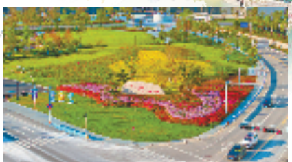
洞头以最美形象迎接亚运会,持续提升城市品质全域提升、全面提质。

为了让海岛更具颜值,去年开始,洞头还以更高层次推进环境修复提升,组建“海上花园”绿化彩化美化委员会,全民动员栽花种树,扮靓入岛门户。其中,作为当地“迎亚运、促发展”的重大民生