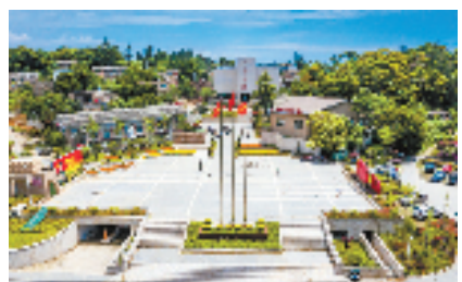
洞头先锋女子民兵连纪念馆

工程,迎宾环线建设项目也于去年全面开工。该项目包括从霓屿坝头入城沿330国道、洞头峡跨海大桥、霞光大道到白迭隧道的环境综合整治和改造提升工程,覆盖小朴、九斤、鸽尾礁等13个渔村周边环境整治提升,通过点、线、面有机推进“六边三化三美”,串珠成链、连片成景。