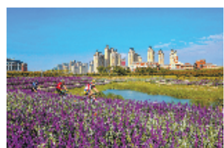
美丽的“海上花园”吸引了众多全国车友前来。

今年3月,位于大门岛的温州新能源电池材料产业园项目迎来签约,洞头与永青股份、格林美、伟明环保、新宙邦等新能源龙头企业成功“牵手”,共同做优做强温州新能源电池产业全链条。投产后预计年