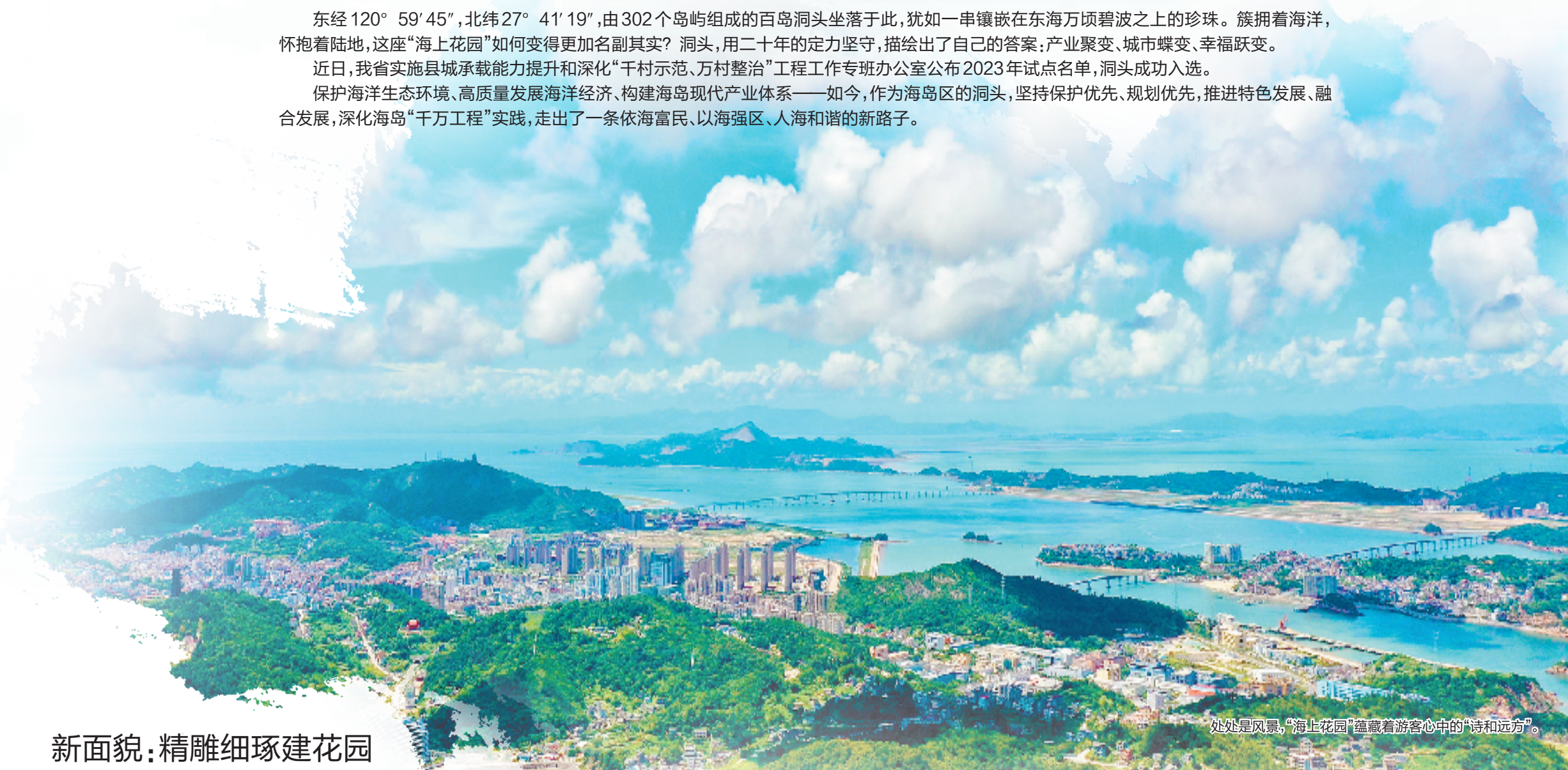
处处是风景,“海上花园”蕴藏着游客心中的“诗和远方”。

保护海洋生态环境、高质量发展海洋经济、构建海岛现代产业体系——如今,作为海岛区的洞头,坚持保护优先、规划优先,推进特色发展、融合发展,深化海岛“千万工程”实践,走出了一条依海富民、以海强区、人海和谐的新路子。