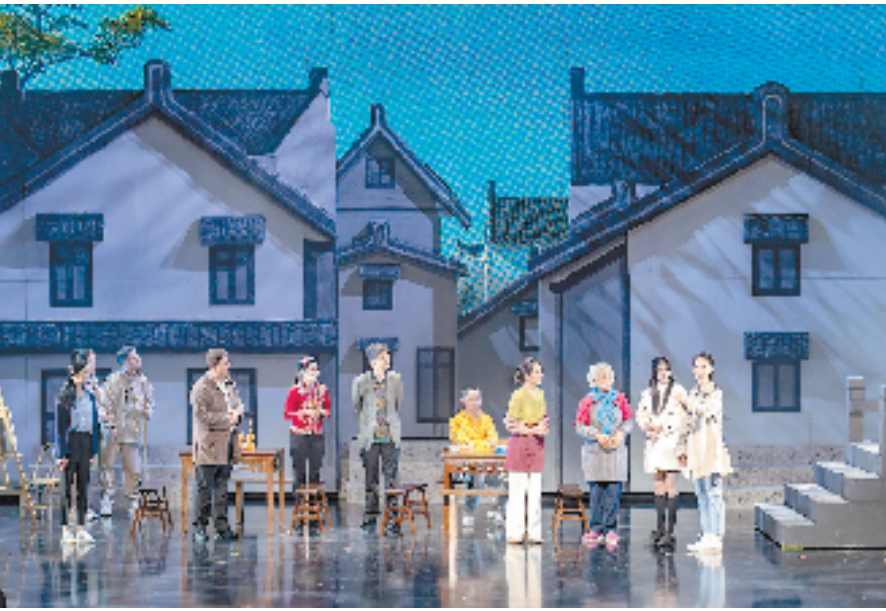
原创现代话剧《明月山塘》

今年，平湖提高工作目标，完成和提升了111个“15分钟品质文化生活圈”，实现了村社区全覆盖，并先后获得省5A级景区城区、省民间文化艺术之乡荣誉。 8月，夏日炎炎，夜晚成为人们外出的“黄金时间”，或带上家人，或约上好友，逛一逛东湖和明湖，感受平湖传统文化成了市民的优选。博物馆、文化馆、名人纪念馆、城市展示馆等坐落在明湖边上的公共文化设施，掩映在绿树浓荫中，与城市景观共融。 走进平湖市博物馆，5个展览厅充分阐释了平湖的城市精神，“作为目前嘉兴地区最大的县级博物馆，馆内还设置了少儿互动区、少儿文博书吧、文博主题餐厅、志愿者活动室等公共服务空间。”平湖市博物馆相关负责人表示。 自去年9月新馆开馆以来，博物馆参观人数超12万人次。今年暑期，已开展