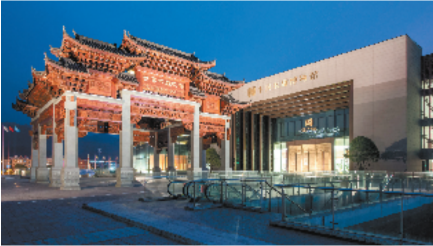
中国木雕博物馆外景