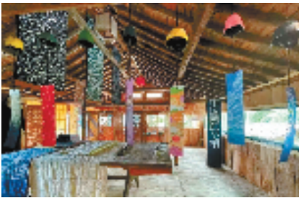
林栖三十六院——蓝印花布工坊

积极链接各方资源，在此期间开展“艺术赋能乡村对话研讨会”等一系列文化交流活动，致力于用艺术唤醒乡村、振兴乡村。 通过文旅的深度融合，一个个环境优美、功能多元、特色鲜明的新型文化空间，正焕发勃勃生机。