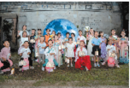
东皋文化驿站——中秋灯会

文化惠民 文化润乡、文旅共富。 自东阳市全力推动浙江省公共文化服务现代化先行县创建工作以来，崭新的文化礼堂传来了悠扬的曲艺；老旧民房经过修缮，白墙黑瓦重新焕发出了生机；新建的乡村博物馆、非遗体验基地为村子注入了青春的活力。