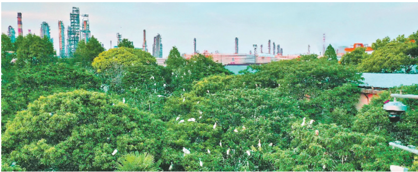
栖息在宁波镇海炼化园区内的白鹭。