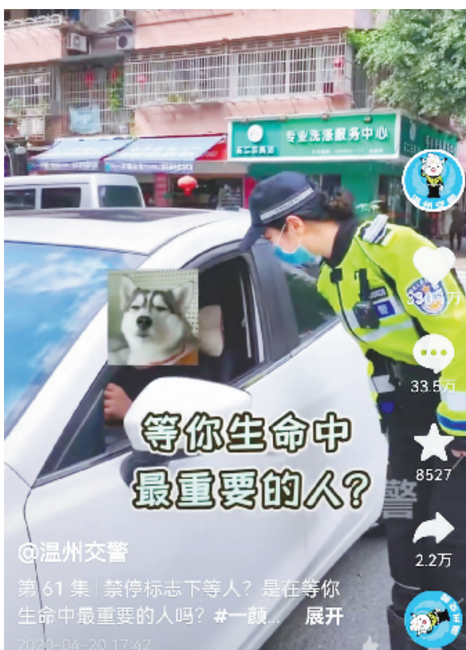
温州交警获得330万点赞的视频截图。

从反映执法为民的“铁男热线”“一颜难尽”,到解读政策的“涵来黍往”,再到记录交警工作的“叮当小警”……通过一个个多元立体、富有个性化的超级IP,温州公安在新媒体的可视化传播中形象展现了不同面孔,警察“人设”也变得更加真实生动可亲近。以“温州交警”抖音号为例,至今该账号共发布作品2700余条视频,播放量超过40亿余次,收获粉丝近640万,获赞1.2亿次。影响力也已走向全国,成为名副其实的全国大号,统计显示,其省外粉丝目前占比已高达87.5%。