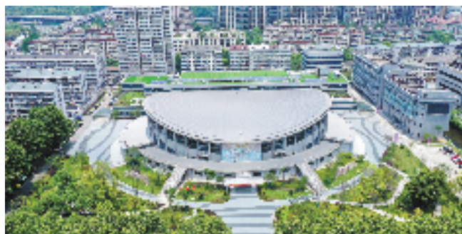
图为改造升级后的杭州体育馆。