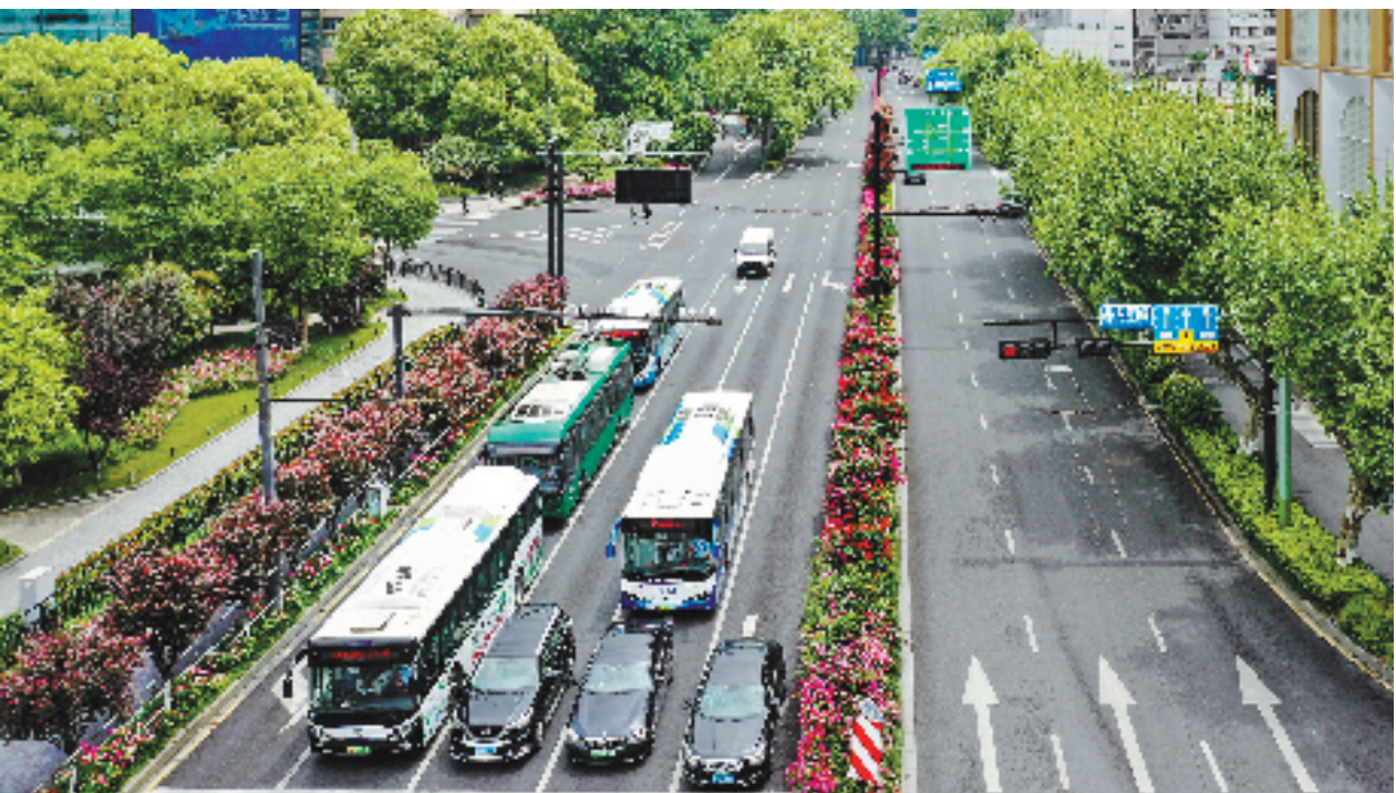
图为杭州市中心的体育场路。