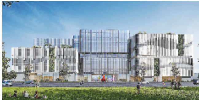
浙江省全民健身中心效果图。