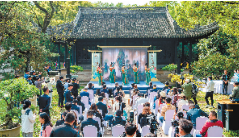
人文绍兴，筑梦亚运——2023绍兴文旅“唐风宋韵”媒体联合推广行动。