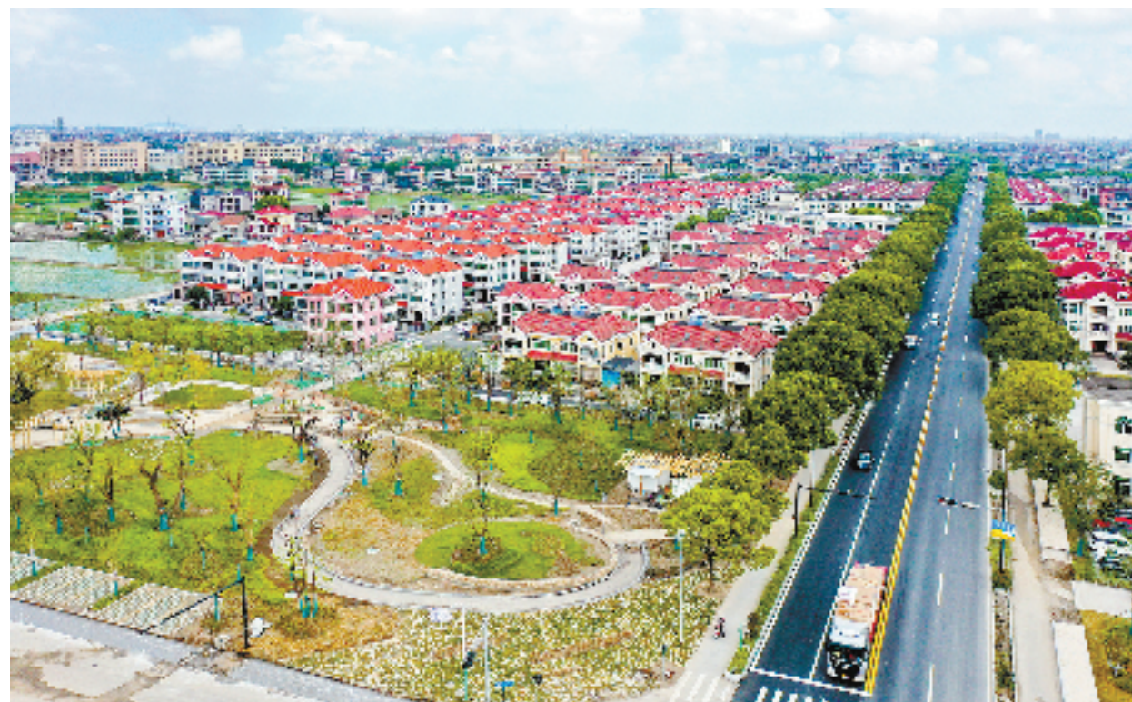
农行萧山分行发放4000万元“美丽乡村贷”，支持梅林村未来乡村建设。