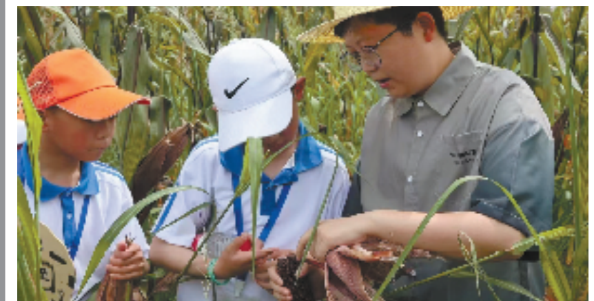
运河街道特色研学项目

求,深挖特色资源,打造乡村共富新IP。近年来,崇贤街道坚持做好“党建+”文章,梳理红色档案,打造教育培训、参观研学基地,依托特色旅游路线推进农旅融合式“共富工坊”建设,不仅实现了红色育人,也实现了富民增收。