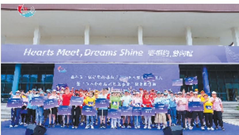
临平区“红邻党群·奉献亚运”五大赛道发布仪式

求,深挖特色资源,打造乡村共富新IP。近年来,崇贤街道坚持做好“党建+”文章,梳理红色档案,打造教育培训、参观研学基地,依托特色旅游路线推进农旅融合式“共富工坊”建设,不仅实现了红色育人,也实现了富民增收。