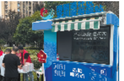
东湖街道党群服务站

这只是南苑街道党群阵地服务党员、群众的一个缩影。目前,南苑街道聚焦“一心”领航带动,构建“由点到线、连线成面、聚面成网”的党群服务矩阵体系。依托“服务汇、健康汇、邻里汇、公益汇”四汇空间打造的“红邻同心”党群服务品牌,今年已累计开展“扮靓家园,喜迎亚运”“银龄互助、平安家园”等志愿服务860余场,服务群众7.2万余人次。