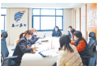
今年初,海宁市检察院检察官与听证员围绕生活垃圾处理相关问题进行闭门评议。

“接下来,我们将不断探索检察助力基层治理体系和治理能力现代化的工作举措,以实干开路,以实绩实效为评判标准,在‘务实、做实、落实’上下功夫,提升人民群众获得感。”海宁市检察院主要负责人说。