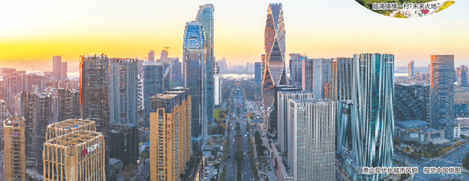
萧山现代化城市风貌