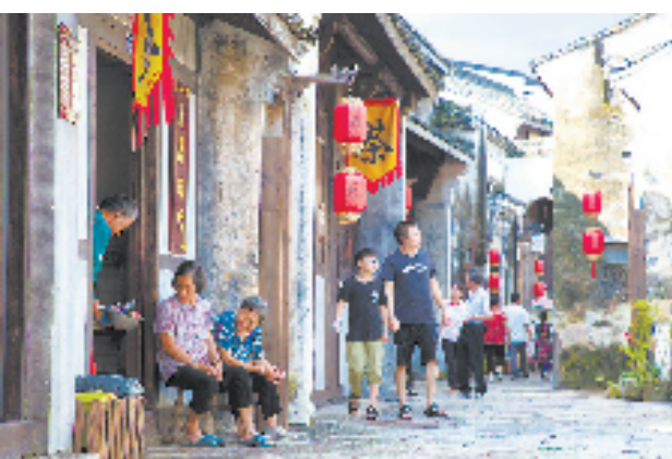
萧山乡村景点游人如织

从先发，到领跑，萧山现代社区建设给群众带来了哪些改变？不断创造新的高度的内生动力是什么？对经济社会发展有什么样的牵引作用？