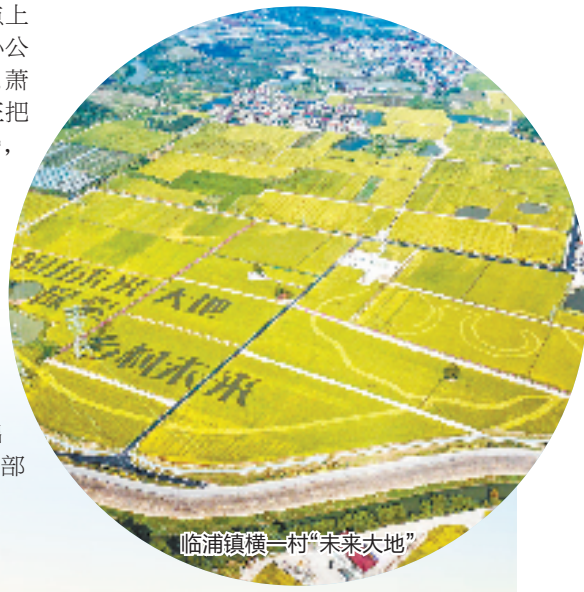
临浦镇横一村“未来大地”

未来，杭州市提出2025年未来社区要覆盖40%左右的城镇社区，2035年基本实现未来社区全域覆盖。萧山作为先行地区，将超前发力，力争提前3年至5年实现未来社区全域覆盖的目标。今年下半年，萧山计划完成12个省（市）级未来社区创建验收，完成6个省级和15个市级未来乡村创建验收，完成6个示范型和8个基础型城郊接合部创建验收，加快4条组团振兴示范带建设落地，全力打造具有萧山辨识度、群众叫好的城乡现代社区建设样板。