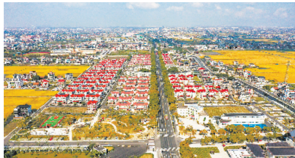
俯瞰萧山区瓜沥镇梅林村