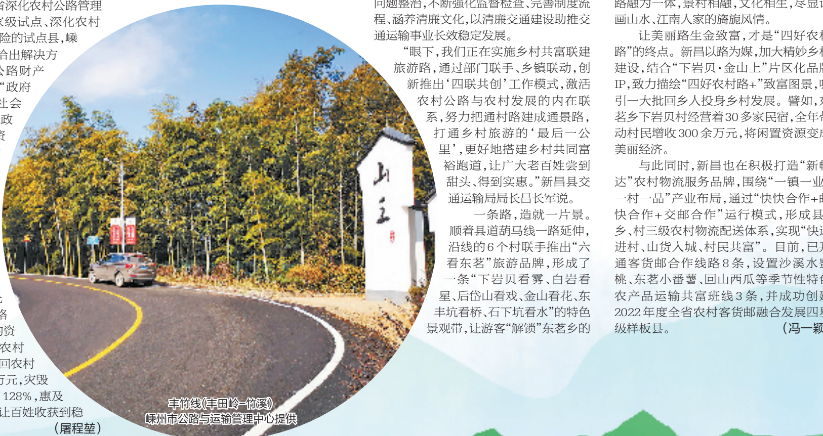
穿物线(丰田岭—穿线岭)

与此同时，新昌也在积极打造“新畅达”农村物流服务品牌，围绕“一镇一业、一村一品”产业布局，通过“快快合作+邮快合作+交邮合作”运行模式，形成县、乡、村三级农村物流配送体系，实现“快速进村、山货入城、村民共富”。目前，已开通客货邮合作线路8条，设置沙溪水果桃、东茗小番薯、回山西瓜等季节性特色农产品运输共富班车3条，并成功创建2022年度全省农村客货邮融合发展四星等级样板县。（冯一颖）