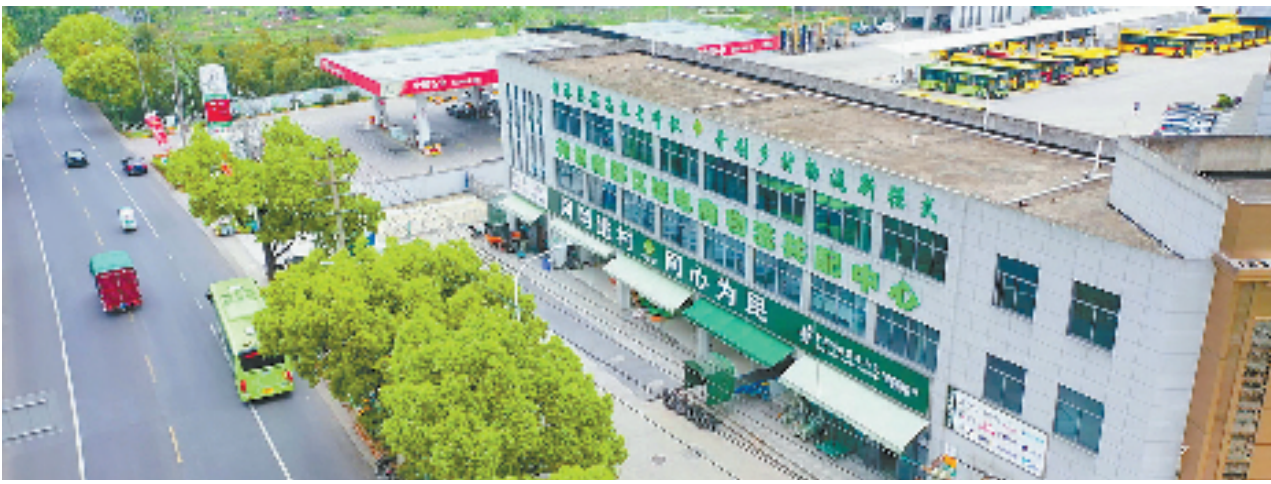
南部区域电商物流共配中心

行进在绍兴市柯桥区平王线，交通运输部公布的2022年度“十大最美农村路”之一，只见林海茂密，远山如黛，沿线山路上串联着若耶溪、日铸岭古道、宋家庙非遗馆、舜驾寺、王化古村等几十个自然人文景点，秀美山峦间的“四好农村路”不仅盘活了当地的旅游资源，也带动村民的致富道路越走越宽。