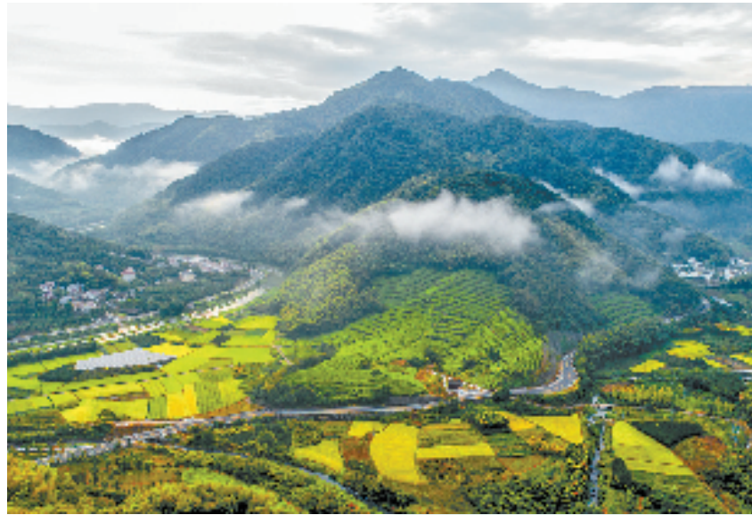
如诗如画覆卮山路

值得一提的是，今年是我省“除险保安强化年”，为了保障群众出行安全，上虞区交通运输局作为交通隐患整治工程的主力军，勇担使命，计划用5年时