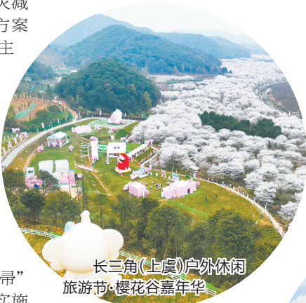
长三角(上虞)户外休闲旅游节·樱花谷嘉年华

而今，随着农村路治理能力得到显著提升，上虞区凭借良好的路网格局与产业振兴、乡村振兴有机融合，为县域经济高质量发展插上了腾飞的翅膀。