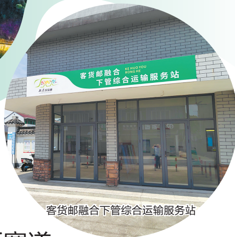
客货邮融合下管综合运输服务站

据了解，2022年上虞区共有5个自然村通公交，今年以来，又有9个自然村通公交。“四好农村路”的建设为自然村通公交延伸扩面打下了坚实的基础，不但方便了村民出行，也带动了公路沿线乡村经济发展。