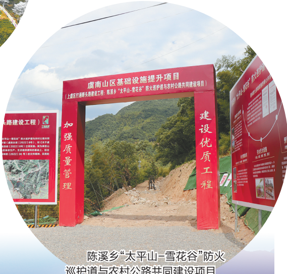
陈溪乡“太平山—雪花谷”防火巡护道与农村公路共同建设项目