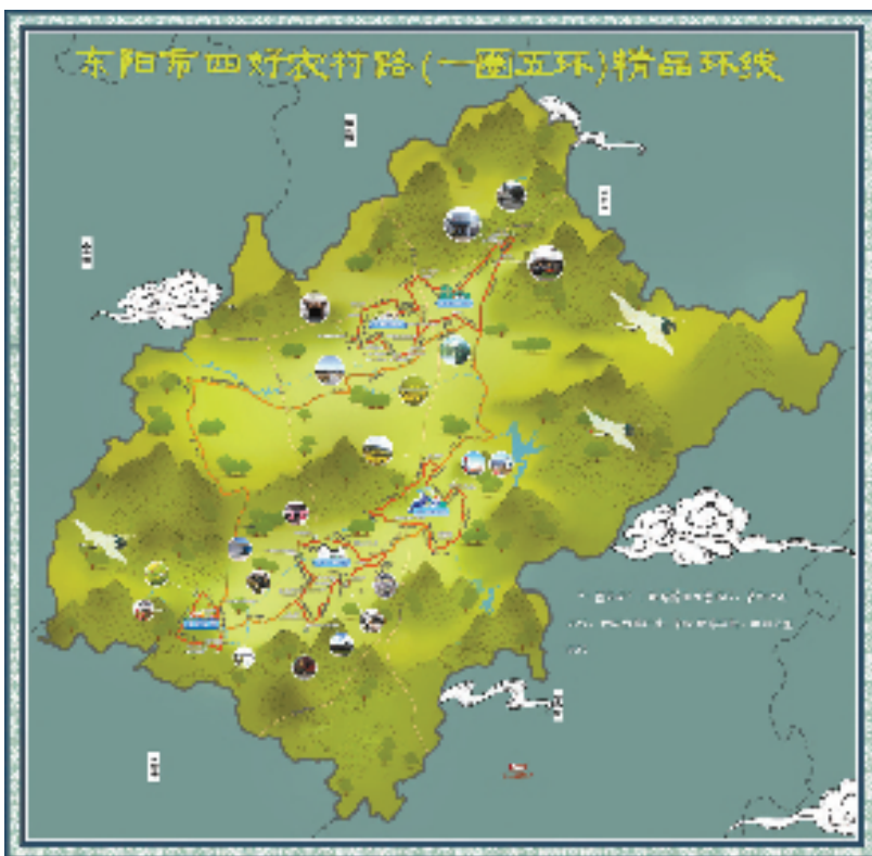
“一圈五环”精品环线