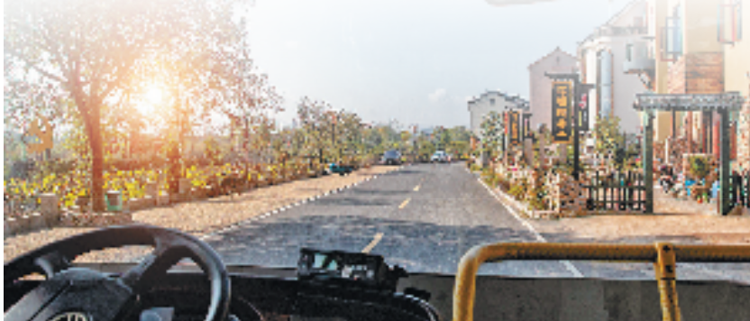
农村公路助推农家乐

民营经济是浙江的金名片，也是浙江经济的最大特色和最大优势。立于浙江民营经济潮头的东阳，在“四好农村路”建设、管理、养护、运营领域，也十分重视引入社会资本，通过购买第三方服务，推动农村公路事业向着“专业化、市场化”迈进。同时，为了筑牢风险管控防护墙，东阳市扎实推进完善信用监管机制，将工程建设、市场化养护、公交运营等重点领域纳入重