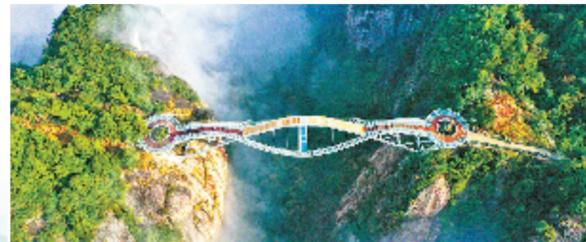
神仙居（国家5A级）如意桥