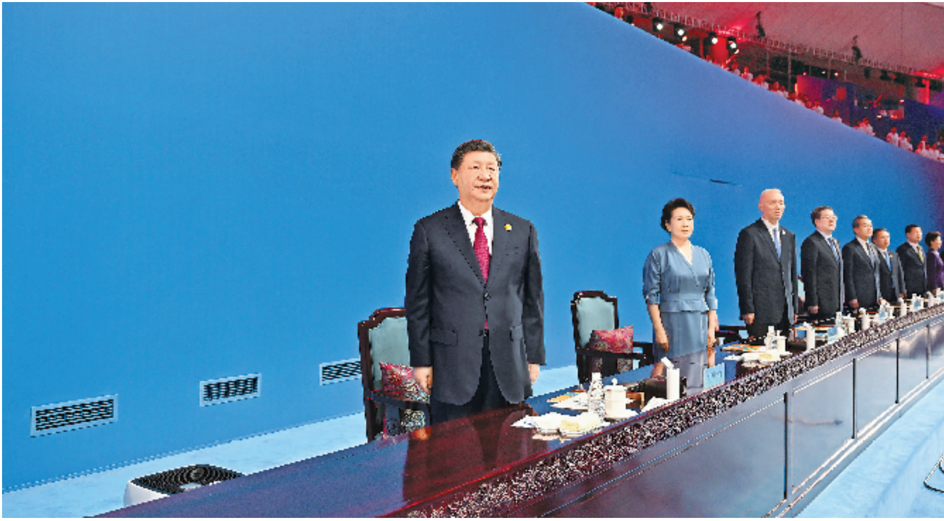
7月28日晚,第三十一届世界大学生夏季运动会在四川省成都市隆重开幕。习近平、蔡奇、丁薛祥等党和国家领导人出席开幕式。

新华社成都7月28日电 共享大运盛会,共谱青春华章。第三十一届世界大学生夏季运动会28日晚在四川省成都市隆重开幕。国家主席习近平出席开幕式并宣布本届大运会开幕。