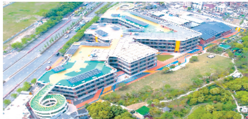
浙江元宇宙产业基地

今年是“八八战略”实施二十周年,笕桥街道相关负责人介绍,街道将立足自身发展基础和优势,加速构建多点支撑的产业新格局,外引内培总部经济,重点发展元宇宙及智能制造两大特色产业,加快打造新的经济增长点。同时,街道联合区投促局精准施策,推动筑商企业与楼宇协会进行党建共建,实现事务共商、难题共解、资源共享,最大限度推动整体发展。