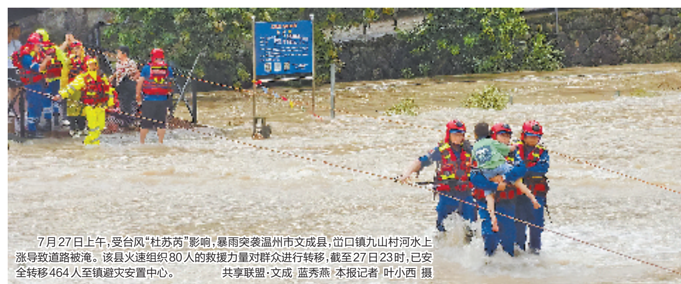
7月27日上午,受台风“杜苏芮”影响,暴雨突袭温州市文成县,岙口镇九山村河水上涨导致道路被淹。该县火速组织80人的救援力量对群众进行转移;截至27日23时,已安全转移464人至镇避灾安置中心。

受“杜苏芮”外围云系影响,27日,我省东部地区出现中到大雨。其中温州、台州、宁波南部、丽水东部等地有大到暴雨,部分大暴雨,个别特大暴雨。截至27日17时,全省共有120个预警,其中仙居、乐清、黄岩等多地发布暴雨红色预警。省气象台预计,28日白天沿海和浙南地区有中到大雨,其中丽水、温州、台州、宁波南部有大到暴雨,部分大暴雨,个别特大暴雨;其他地区有阵雨或雷雨。28日夜里到29日,浙西和沿海地区有中到大雨,部分暴雨,局部大暴雨;其他地区部分中到大雨,局部暴雨。