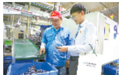
农行金华经济开发区支行工作人员走访“专精特新”企业，了解企业生产经营情况。