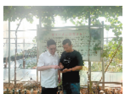
“葡萄贷”精准助农——拓宽产业富民路。

金融活，经济活；金融稳，经济稳。眼下，金华各金融机构不断加大对重点领域、重大项目的支持力度，为稳投资、稳增长、保民生注入更多金融“活水”，为金华经济实现稳中有进积蓄更多后劲。