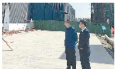
客户经理走访金华某建设项目施工现场。

金华市秋滨污水处理厂四期扩建及提标改造工程是省“五水共治”碧水行动的重要内容，也是金华市重点民生工程，对改善区域水环境、提升城市功能和品质发挥积极作用。招商银行金华分行对该项目高度重视，紧盯项目规