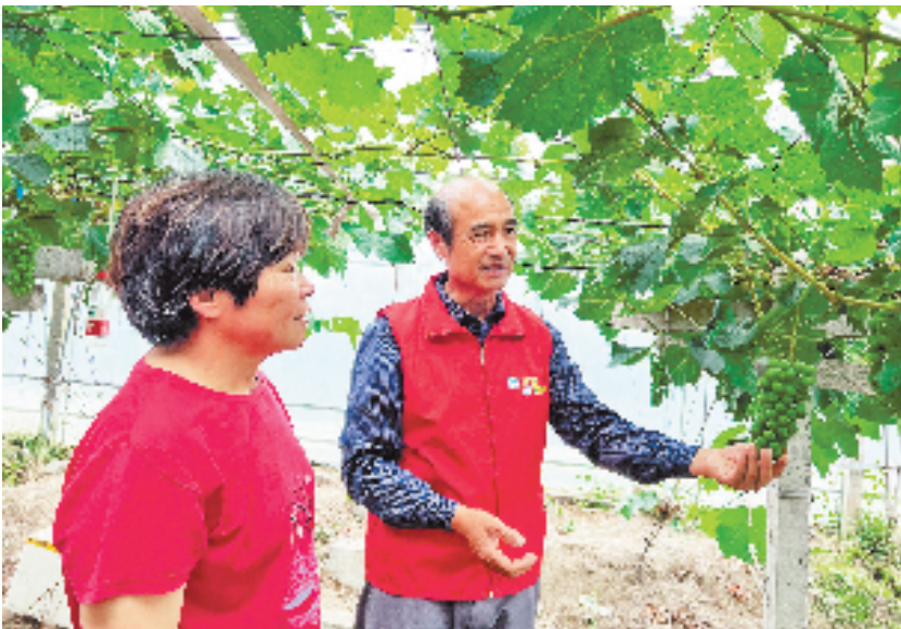
于城镇葡萄种植大户在田间地头进行技术指导