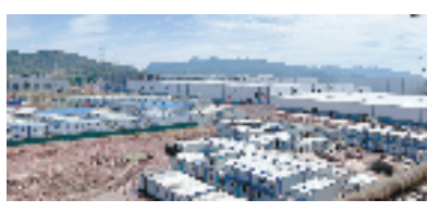
浙江义欣新能源动力电池生产基地项目一期施工现场。

建行义乌分行积极与企业开展项目融资对接，同时联系同业协调授信方案，于2023年4月份成功牵头组建浙江义欣新能源动力电池生产基地项目（一期）银团贷款，银团贷款总额64亿元，建行义乌分行作为牵头行份额