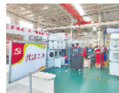
朱家尖“磁电匠心”共富工坊 (图片由舟山市朱家尖街道提供)

欣亚磁电、东和兴隆等企业根据自身需求,以加工车间为主体,不定期发布岗位,吸纳周边渔农村劳动力600余人。同时结合自身优势,为村民提供电工培训、电器维修服务,带动周边渔农民年增收300万元。村党组织与附近企业资源共享、理论联学、活动联办,联合组织“书记上党课”、八一建军节慰问、环境整治等活动10余次。村组织不定期进企业走访,收集企业发展难题,并向街道反馈,特别是在企业打造“党员示范岗”以及特色党建品牌等方面出谋划策,提升附近企业的党建工作水平,让“红色引擎”助推企业发展,进而实现双方共赢。