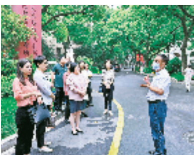
专家团为社区参训学员开展现场教学

为进一步巩固拓展村社组织换届“回头看”工作成果，扎实做好“回头看”后半篇文章，近日，杭州市上城区以辖区九堡街道为试点，启动了“头雁领阵”金牌书记工作室暨社区治理