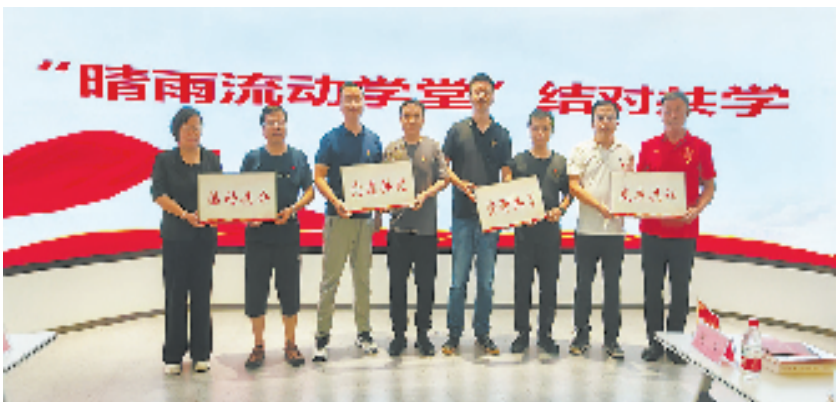
湖滨街道推出“结对共学”机制

湖滨街道共有239位。今年街道建立8个流动党支部，覆盖社区、两新、商圈各级党组织，依托幸福邻里坊、尚小驿、党群服务中心等阵地资源，深入实施结对共学机制，在护航亚运、志愿服务、网格考赛上全面开启“党群阵地与社区党委、支部与支部、支部与网格”之间互联互通模式，构建起组织形态的集成创新链。