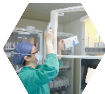
医护人员正在领用手术药品及耗材

截至目前，萧山医疗机构通过近3个月的磨合使用后，已经构建起全区医疗耗材数据的透明化网络，做到医疗耗材的全流程可追溯和一体化集中管理。在医用耗材监管平台上，归集了萧山4个医共体，包括含7个区级医院和24个卫生院在内的耗材流转数据，逐步搭建起信息互通、实时监测、数据分析、智能预警的一体化数字平台。后续，萧山还将继续完善医用耗材监管平台，让数据更透明，耗材使用更阳光。