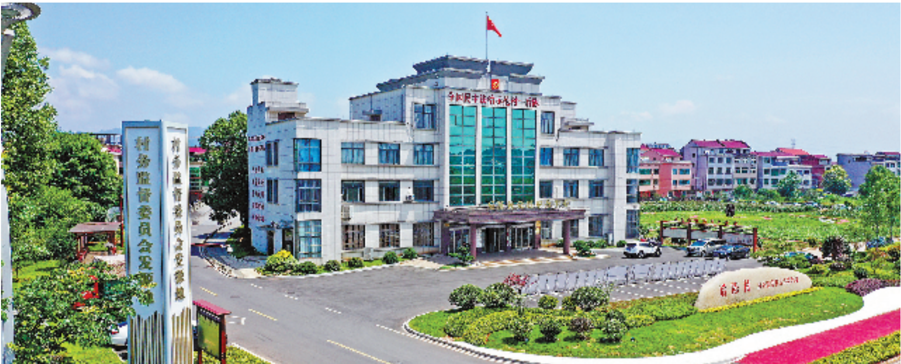
以村务监督委员会为核心的“后陈经验”大大激发了全村的干事创业热情。2004年以来,后陈村村集体经济年收入增长43倍,村民年人均收入翻三番。图为后陈村村景。

第一,发展民主主要从中国的实际出发。习近平同志指出,“推行民主当然重要,但是民主模式具有多样性、复杂性,究竟选择什么样的民主模式,取决于一国的具体国情,包括历史、经济、文化、社