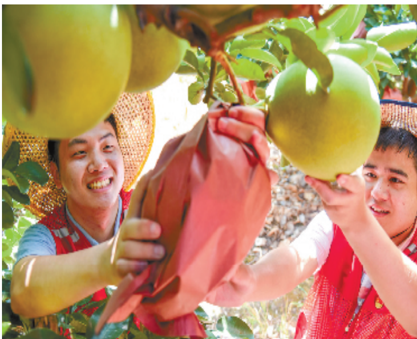
玉环市“雏鹰训练营”学员赴基层开展助农活动丰富实践经验

为加快推动中心工作和重点项目建设,玉环市面向全市干部开展“揭榜当先锋、实绩论英雄”活动,精选县乡两级重点工作、重点项目及亟需集中攻破的老大难问题作为攻坚项目,分批次面向全市发布,综合比选专业能力强、干事热情高、培养潜力大的干部作为揭榜对象,组团签订攻坚任务书并作为攻坚目标承诺。截至目前,已发布榜单3期,签约重点项目19个,吸引揭榜干部117人。