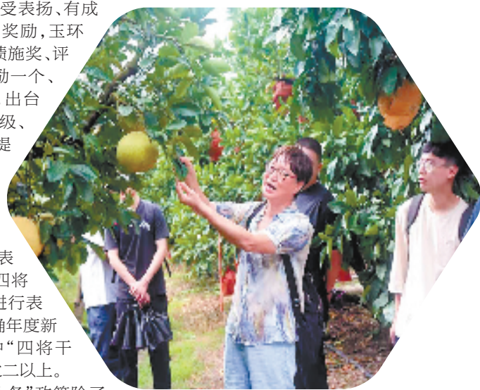
玉环市农业农村局组织新录用公务员开展一线实景教学研究提升业务水平

培优建强敢为善为有为的干部队伍,关键在于推动干部能上能下,除了做“加法”,让实干型干部上得来,也要做“减法”,让不担当、不负责、不作为的干部下得去。能上能下,关键在下,难点也在下。去年以来,玉环市在全市各单位大力开展无“躺平式”干部、无“混日子”干部“双无”单位创建活动,建立15种“不担当不作为”情形清单,及时发现整治上任后“躺平式”“混日子”干部94名,给予诫勉谈话、通报批评、降级降职、年度考核基本称职或不称职等处理。能者上、优者奖、庸者下、劣者汰,鲜明导向立起来,干部队伍活力就迸发出来了。