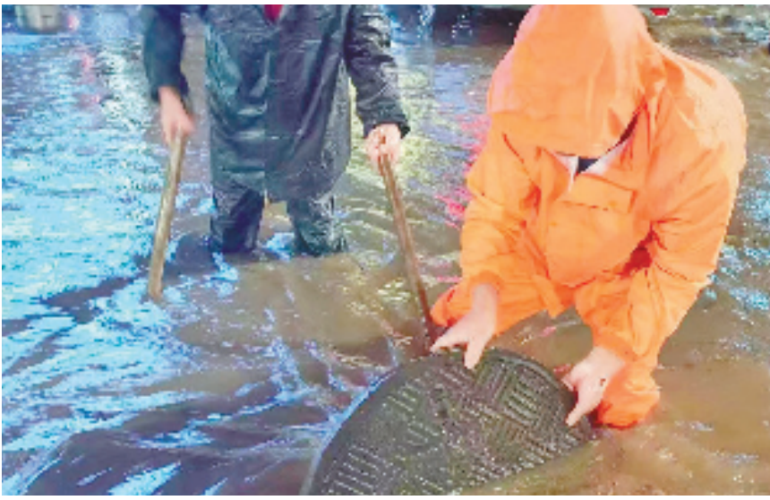
拱墅区半山街道工作人员紧急处置排除积水。

暴雨预警连升两级。这也是杭州今年发布的首个暴雨红色预警信号。杭州市防指于19时启动防汛Ⅳ级应急响应。