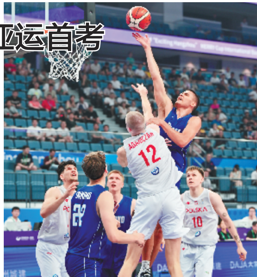
图为芬兰队和波兰队比赛现场。