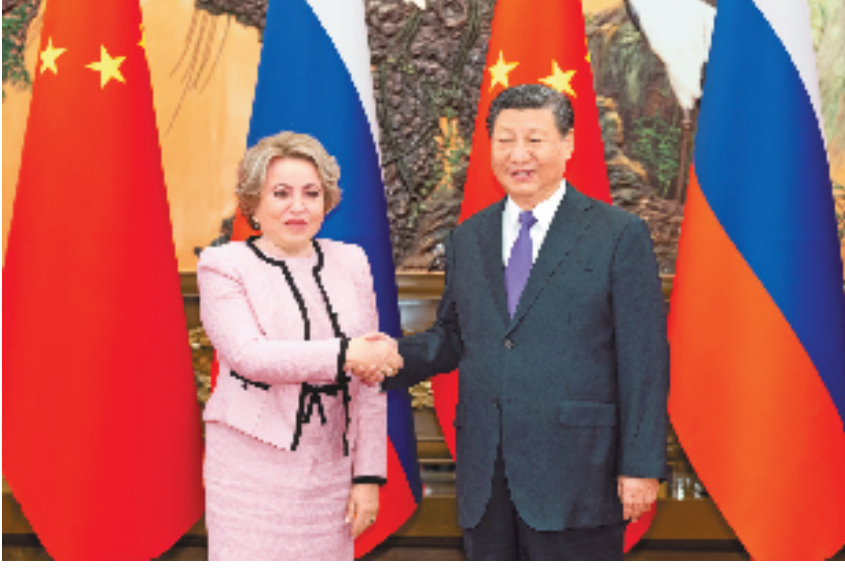
7月10日下午,国家主席习近平在北京人民大会堂会见俄罗斯联邦委员会主席马特维延科。

共同努力,落实好我同普京总统达成的重要共识,从立法层面促进和保障两国各领域合作持续健康发展,加强立法及治国理政经验交流,推动两国立法机构合作再上新台阶。双方还要加强在上海合作组织、金砖国家等多边机制内的沟通协作,引领全球治理改革正确方向,维护好新兴市场国家和发展中国家共同利益。