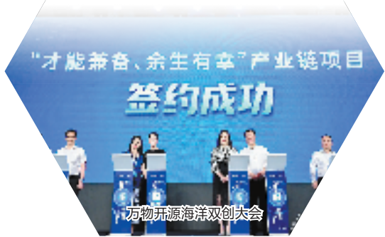
万物开源海洋双创大会

海上一阵风,吹动一座城,北纬30度最美海岸线已经披上了“亚运妆”。从空中俯瞰,即将迎来盛事的亚帆中心一半在陆地,一半在海中。场馆外两座防浪堤,组成了一对“臂弯”。臂弯内,夏日晴空,微风细浪,五颜六色的船艇静静停泊;臂弯外,东海一望无际,帆影点点划出曼妙弧线,他们正扬帆起航,共赴“亚运之约”!