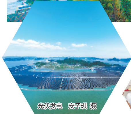
光伏发电