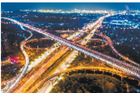
镇海已形成“七横五纵”的骨干路网体系