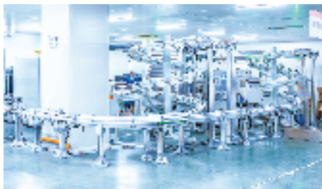
家联科技企业数字化车间