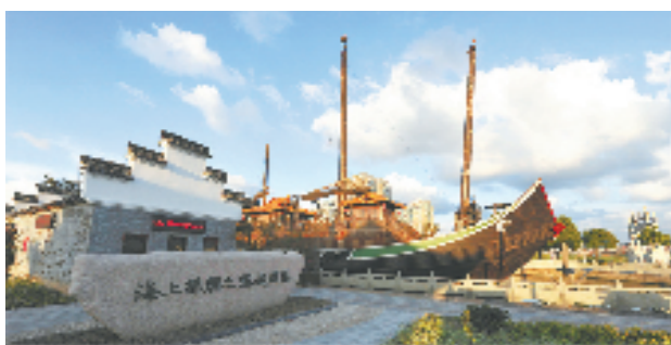
镇海是海上丝绸之路起碇港

以文促产，更要以文润城。2022年，镇海召开文化工作会议暨品质文化之城建设推进大会，明确了“以文化工作大手笔推进城市形象大提升”的目标，让文化因子渗透到城市发展的方方面面。镇海的目标是，到2026年，基本建成精神品格鲜明、人文品韵十足、生活品位多元的文化之城。