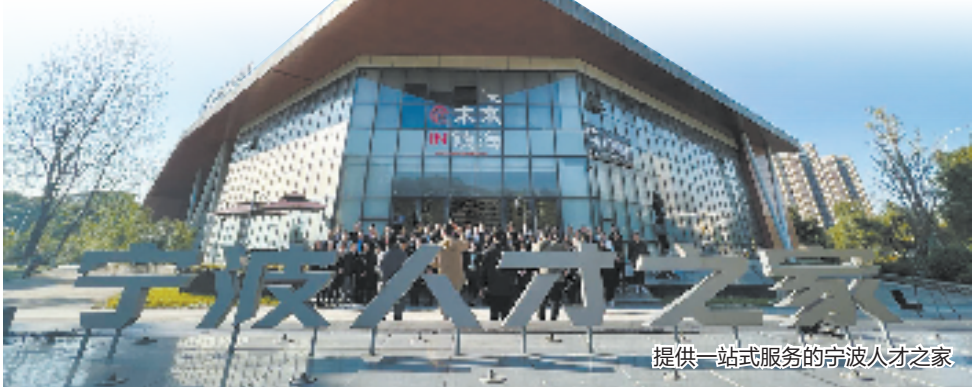
提供一站式服务的宁波人才之家

秉持“项目为王”理念，镇海以重点项目为抓手推进“扩投资优结构”，布局数字产业、未来产业、高端装备制造制造业等产业。近年来，镇海又把“招商惠商安商”行动作