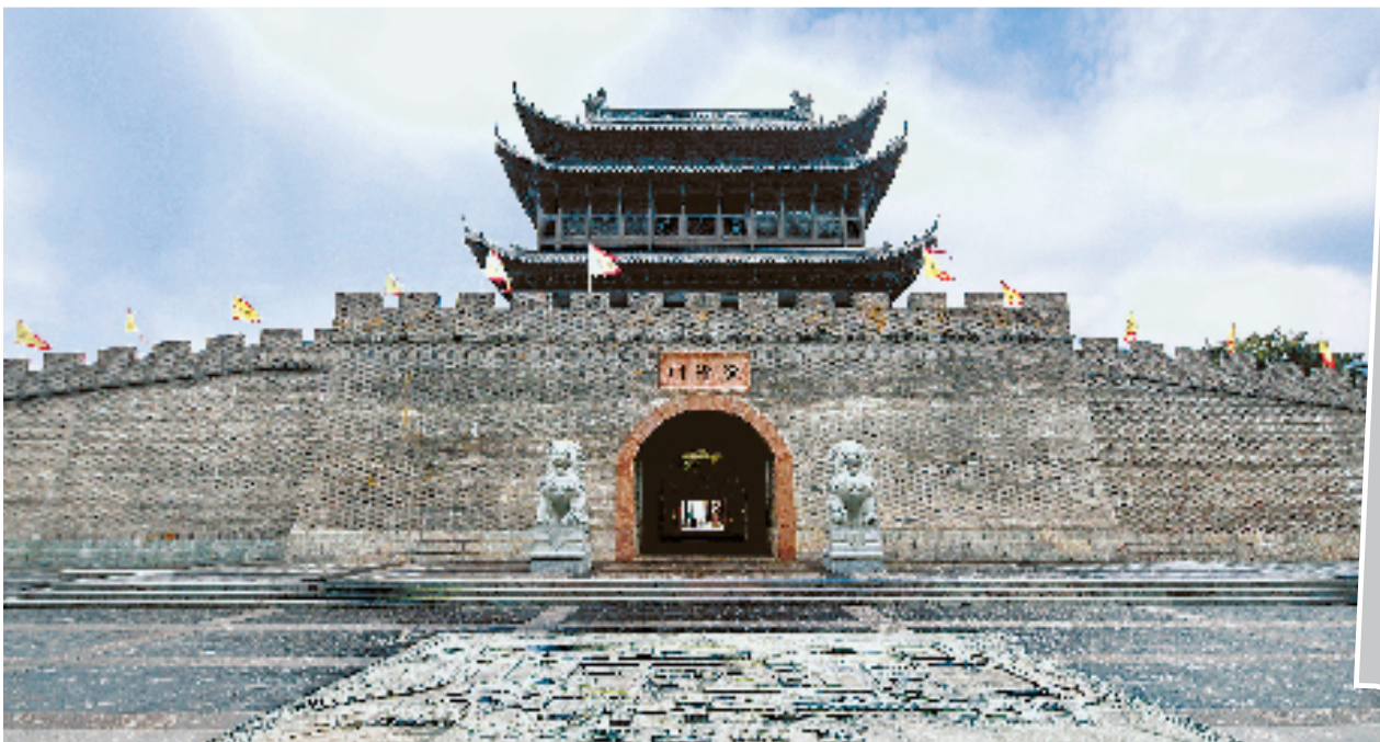
建德市梅城镇澄清门。