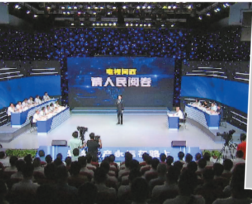
今年6月26日，衢州电视问政节目《请人民阅卷》第35期录制现场。