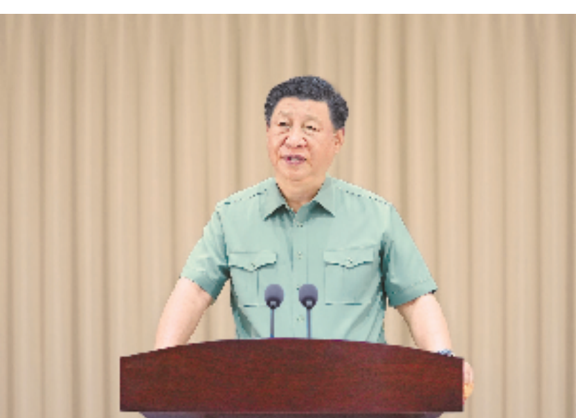
7月6日，中共中央总书记、国家主席、中央军委主席习近平视察东部战区机关，代表党中央和中央军委，向东部战区全体官兵致以诚挚问候。这是习近平发表重要讲话。