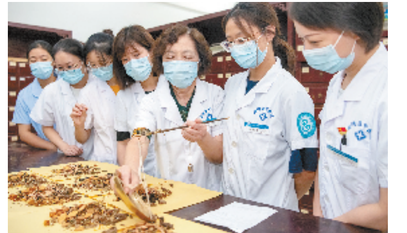
南浔区中医院药房里,新参加工作的医生聆听高年资中药师的教诲,让廉洁观念滋润内心,丰富了该院“望闻问切、香远医清”清廉品牌内涵。

果。”南浔区纪委监委驻区委宣传部纪检监察组负责人说。近年来,该区持续探索智慧监管系统,通过数智赋能,逐步实现权力运行“阳光化”、用药监管“智慧化”和群众监督“便捷化”。 一直以来,用药环节也是医院廉政建设的高风险点,为了让患者安心就医,南浔区卫生健康系统实施“阳光医药、诚信医疗”工程,对患者治疗过程及用药信息进行全面归集,患者凭个人账号即可在健康湖州APP、浙里办APP进行线上查询,切实保障患者的知情权。该区还开发了药品智慧监管系统,加大对辅助用药、国家重点监控药品、非国家基本药物及单月用量增幅过大的药品种类的干预,对数据库进行实时监控,记录重要数据访问日志,发现问题第一时间处理。近两年,南浔区公立医疗机构用药指标明显优化,检查检验占比、医疗服务收入占比、药占比、门诊均次费用、住院均次费用等医改重点指标处于同行业较好水平。 此外,为进一步推动清廉医院建设走深走实,南浔还引入“医点通”就诊满意度测评平台,实行群众监督机制,倒逼医疗机构强化医德医风建设,提高综合服务质量,进一步推动全区卫生健康系统硬件环境、就诊流程等持续改善和各项综合改革不断深化。