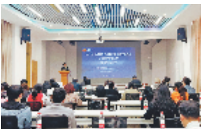
海盐县总工会组织的电商直播培训班

一直以来，海盐县总工会把培训质量和合格率作为评估培训结构的主要指标，严格培训班次审批，培训期间跟踪监督，培训结束后，开展满意度问卷调查。同时，委托第三方在事后开展绩效评估，围绕课程设计、培训质量、就业转化等要素，作出精准评判，拓宽监督渠道，实现培训服务环节闭环管理。同时，以“市场有需求、工会有职责、培训有平台、就业有去处”为标准，进一步做实做优“就在海盐”服务品牌。如去年开展转岗、失业人员工种技能培训3000多人，实现转岗再就业1950人，就业转化率达65%以上，其中直播带货员、电工等重点工种培训，就业转化率达到75%。