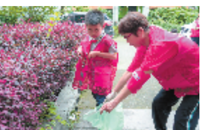
学生参与清洁家园志愿服务。

了社区服务供给，有助于实现‘家校社’四方联动。”石桥街道主要负责人说，后续，石桥街道将精心打造“小手拉大手”基层治理品牌，把“小主人迎亚运”志愿争章行动与“党建领航 石桥优礼”“暖蜂幸福街”以及流动党员“洒爱家”等项目有机结合起来，发挥“1+1>2”的治理成效。