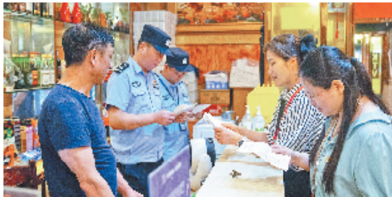
执法检查

坚持干部同育。创建两地纪检监察干部“践初心、提能力、倡廉洁、话监督”共学共研主题项目，定期举办互观互学、交流研讨、风采展示等系列活动，以毗邻共建为平台，切实提高纪检监察干部队伍能力素质。此外，双方还联动开展党风廉政建设宣传教育，共同推进“以案促改”，最大程度凝聚跨区域协同监督合力。