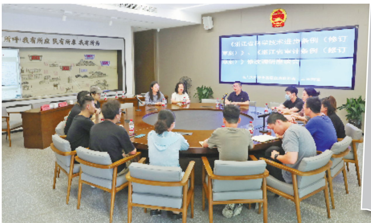
一场法规修改调研座谈会在“五马议事坊”举行。