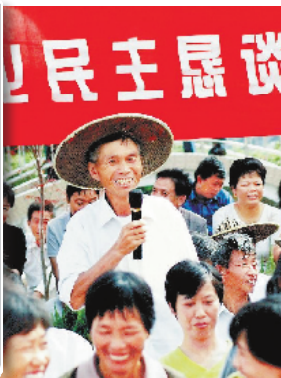
2002年9月18日,温岭市新河镇城西村村民代表在村晒谷场举行民主恳谈会。