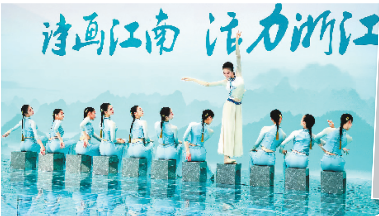
《跼步桥》香港演出舞台群像照。