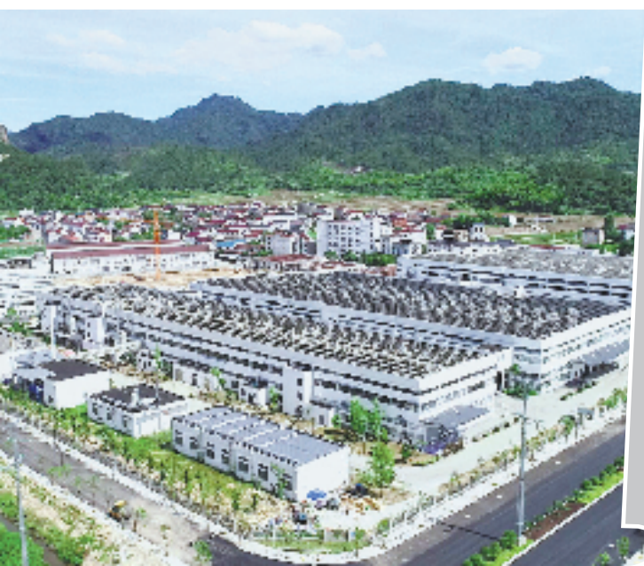
如今的浙江大自然户外用品股份有限公司。