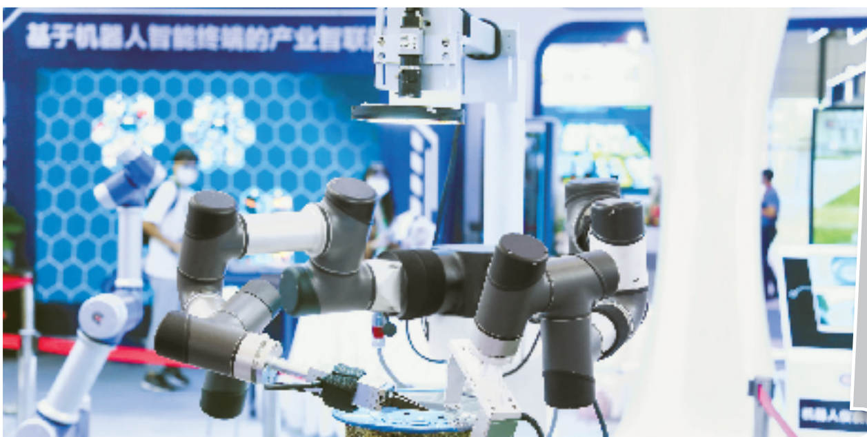
智昌科技机器人产品。