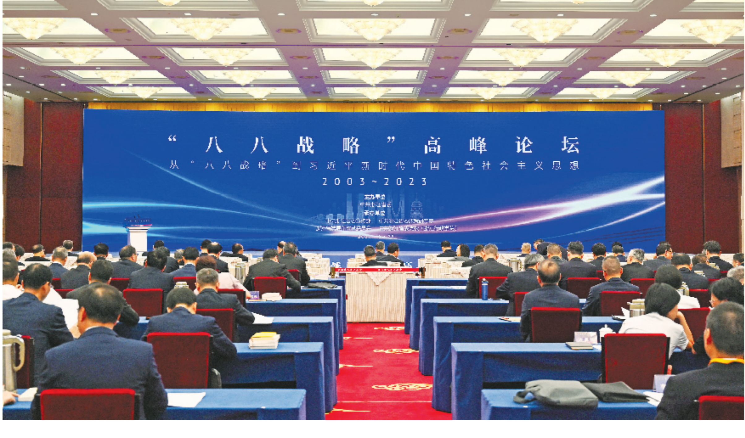
“八八战略”高峰论坛