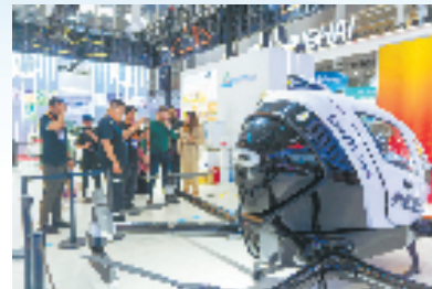
中东欧博览会现场

四是提升展会平台的贸易投资引领功能。从第三届中国—中东欧博览会采购订单来看，与中东欧国家参展商达成进口订单交易额虽然较上届有明显提升，但其中90%以上的订单局限于省内，55%的订单又集中在宁波，尚未形成全省、全国共同参与的发展格局。