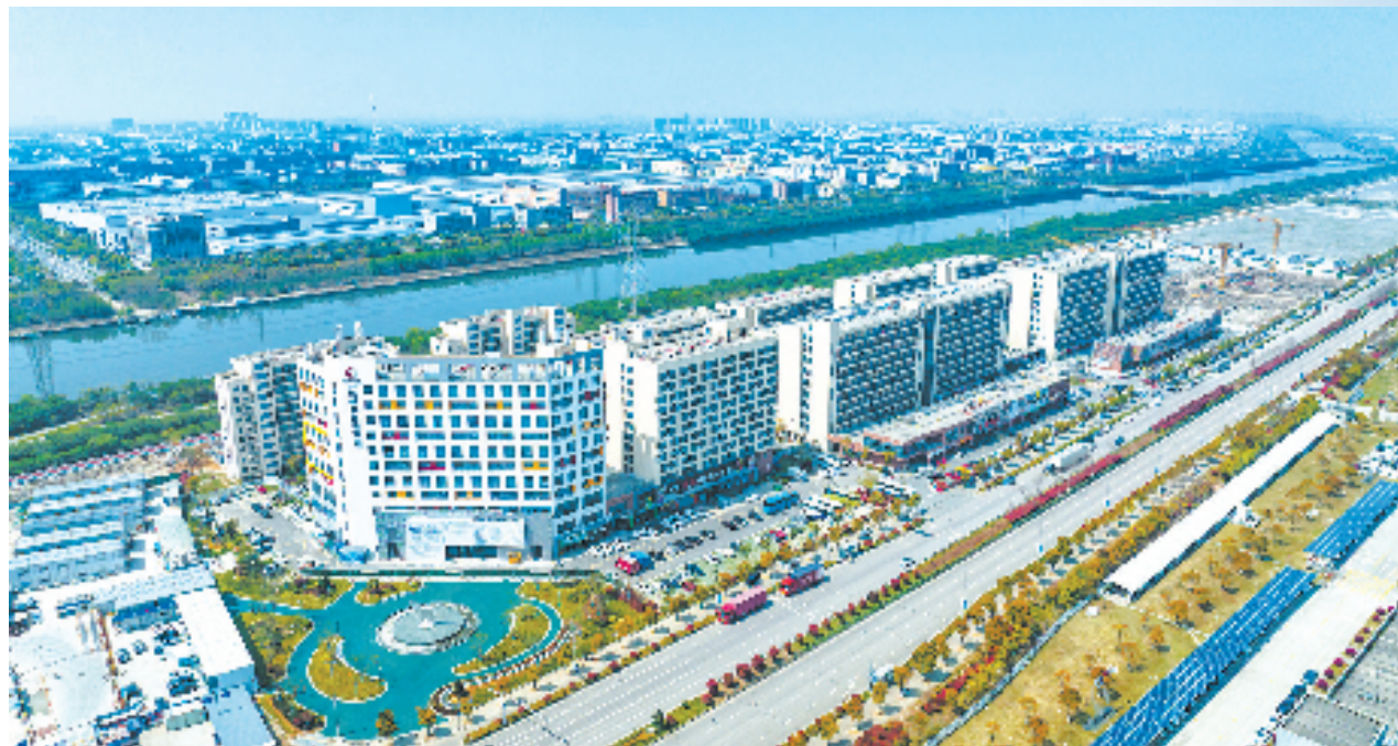
前湾新区海智未来社区

住房租赁监管服务平台”，实现租赁企业开业申报、租赁房源监管、租赁合同备案、租金检测等服务功能；打造“甬易租”住房租赁集成场景数字化应用平台，探索政务服务新模式；开发完成