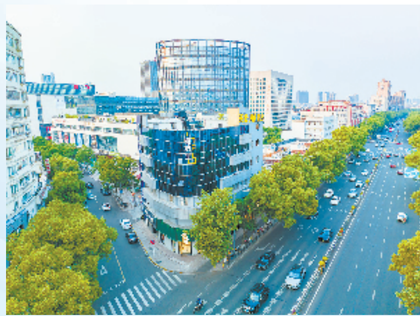
“糖坊里”特色街区

山“糖坊里”举行。“糖坊里”原是一处废弃厂房，也是当地文明创建的“拖后腿”区块。去年以来，浒山街道投入626万元用于“糖坊里”特色街区改造，着力打造沉浸式文旅景观综合型商业街区。今年五一假期，完成二期建设的“糖坊里”商业街区实现销售额610万元，累计客流超百万人次。