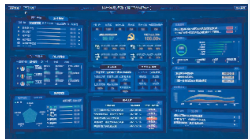
村社减负增效(浙里兴村治社)智慧平台