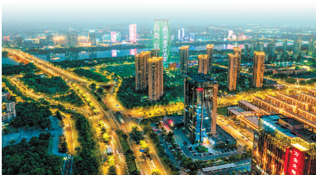
百官街道城市夜景

推动创新深化,关键在党员干部。百官街道坚持党建引领,着力建设变革型组织、担当型干部、先锋型党员,着力破解发展理念不新、创新能力不强的问题。实施村社书记“领雁”、年轻干部“蹲苗”、中层干部“赛马”培育,加强村社专职工作者队伍建设,迭代“考核、资源、项目”三张清单和季度例会、村社书记擂台等赛马晾晒、争先创优机制,让干部在最后一线、最前沿的战斗中得到最充分的淬炼,培树最顽强的作风。此外,百官街道还着力打造一流的政务服务环境,推行便民服