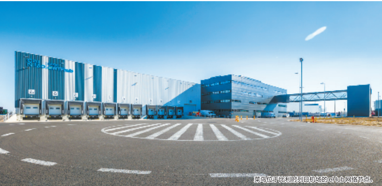
菜鸟位于比利时列日机场的eHUB网络节点。