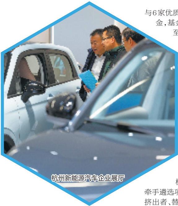
杭州新能源汽车企业展厅