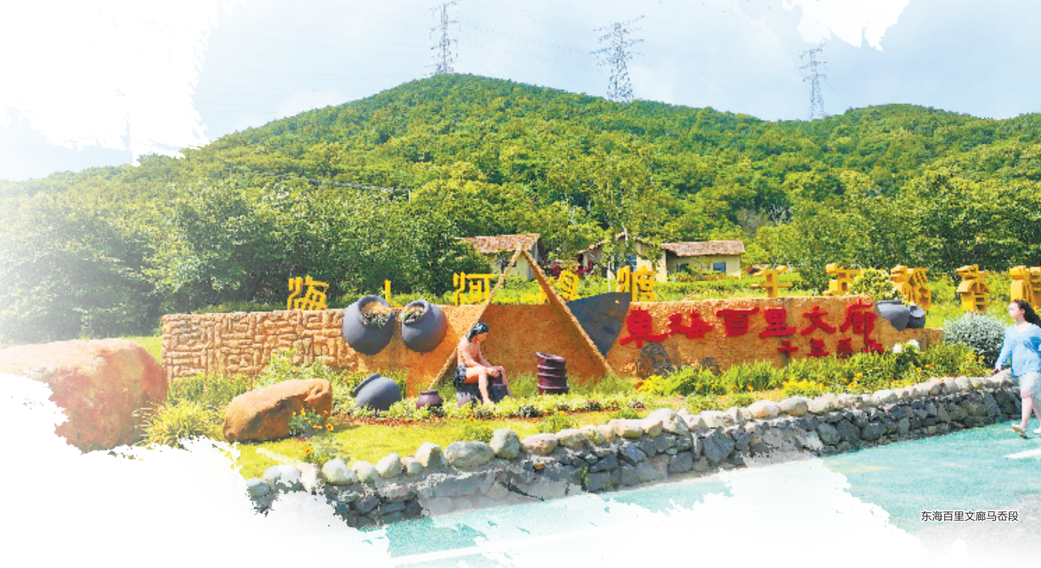
东海百里文廊马岙段