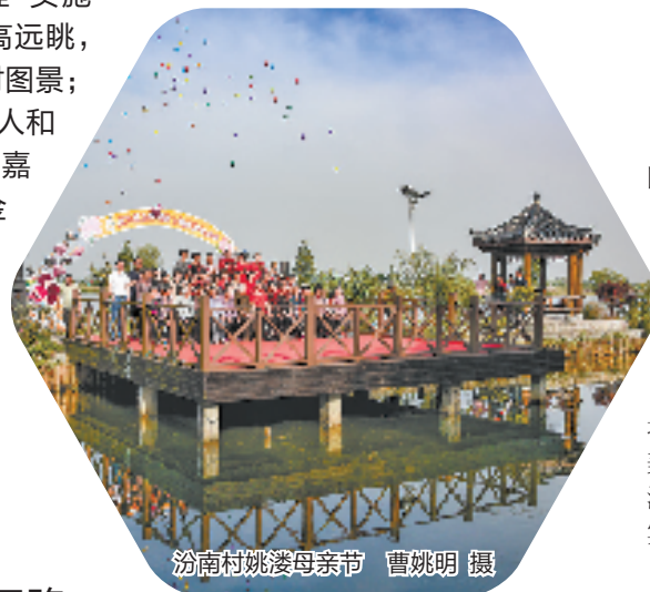
汾南村姚婆母亲节

传统与现代辉映，土气与洋气结合，像地瓜藤蔓一样延展、扩散，嘉善乡村地瓜经济在这片创新的沃土中拔地而起，茁壮成长，为乡村振兴开辟新空间、激发新动能。