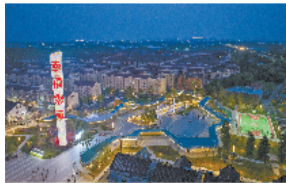
省级未来乡村——缙家村幸福广场夜景