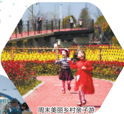
周末美丽乡村亲子游

一个小院就是一方天地。走进大桥镇云东村方家浜,干净整洁的村道、清澈见底的村河,以及随处可见的景观小品,都让人眼前一亮。