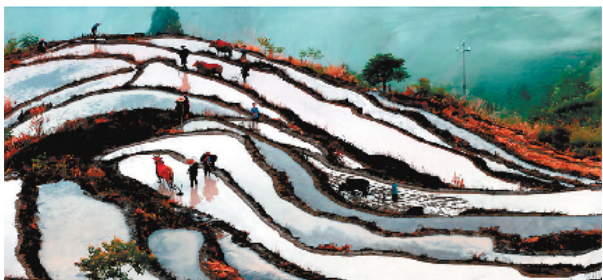
朱溪镇杨丰山村梯田

仙居县以建设新时代美丽乡村共同富裕示范带为引领,推动美丽乡村向美丽经济蝶变,奋力谱写现代化中国山水画卷城市建设新篇章。