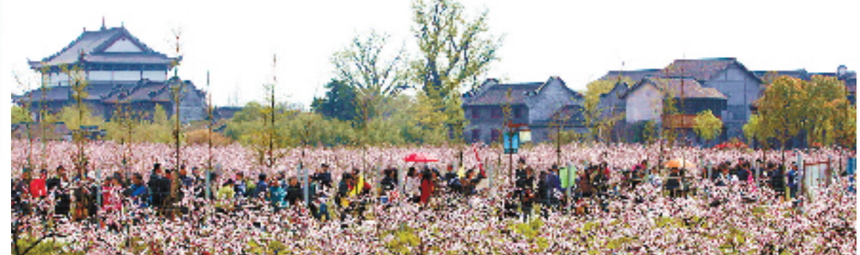
凤桥镇桃花盛开,游人如织。