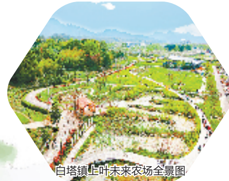
白塔镇上叶未来农场全景图