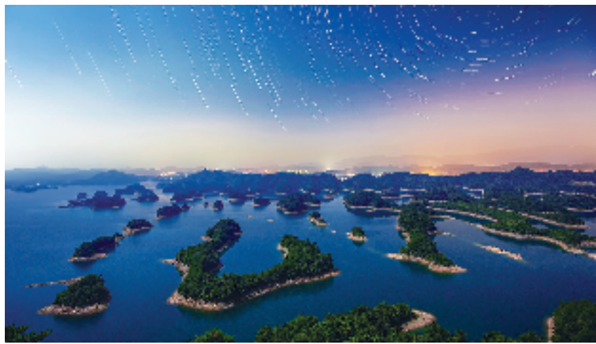
千岛湖——黄山尖眺望

同时，淳安探索全民共管的管护方式，坚持“政府主导、村级主体、全民参与”的共商共建共享美丽乡村建设机制。比如在茶合村，这里实行“党员网格化”管理制度，每个党