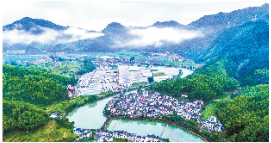
下姜村全景

员既是劝导员又是管理员，还是清洁员，管好自家的“一亩三分田”，还能带动周边村民种好保洁“责任田”，实现“村无保洁员、人人都是保洁员”的共治共管局面。