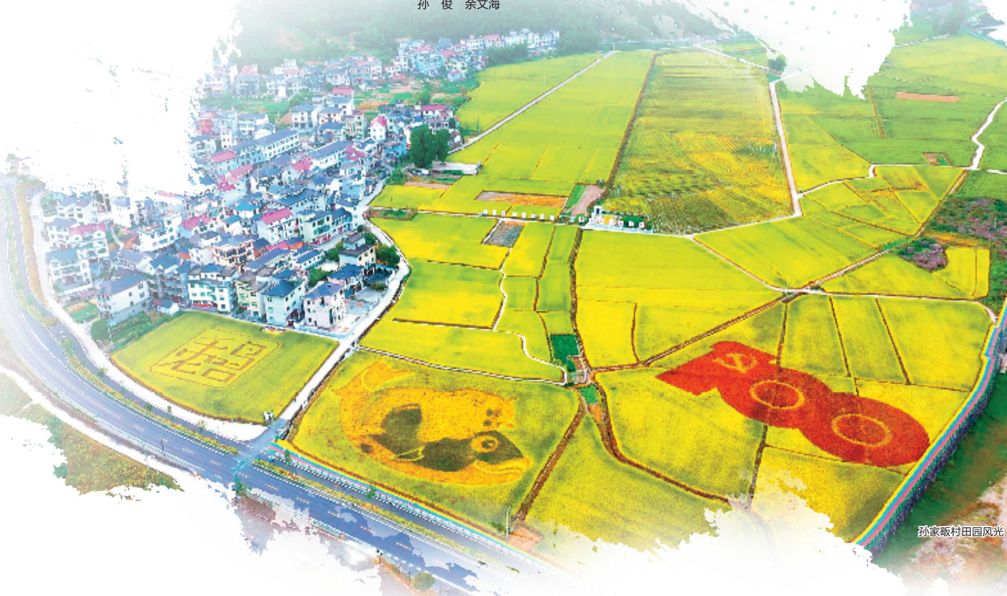
孙家畈村田园风光

淳安实现新时代美丽乡村建设全覆盖、省新时代美丽乡村达标村创建全覆盖，先后荣获全国“四好农村路”示范县、全国村庄清洁行动先进县、浙江省首批全域旅游示范县、浙江省“五水共治”工作优秀县、浙江省农村生活污水治理优胜县、浙江省小城镇环境综合整治优秀县、浙江省公厕改造工作优秀县等荣誉称号，成为浙江“千万工程”的美丽窗口。