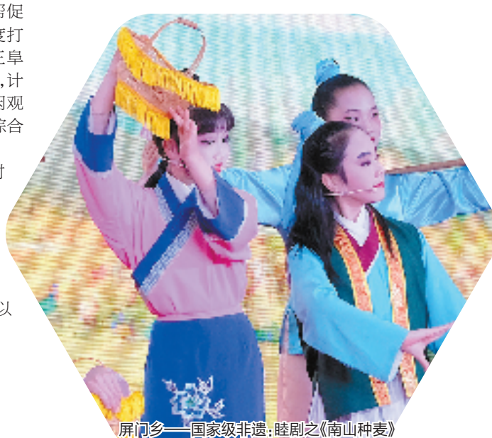
屏门乡——国家级非遗：睦剧之《南山种麦》

那边睦剧唱罢，这边清廉家风吹来。在汾口镇汪家桥村，有省级文保单位汪氏家厅、保存完整的明代圣旨、象征廉洁的草鞋文化及每年举办的传统节庆活动“六月初六晒圣旨”，汪家桥村围绕省文保单位汪氏家厅建设廉政宣教广场，打造“仁义廉礼孝”长廊等特色地标带，同时将孝文化与公园、党建宣传栏等固有景观点位相结合，修整公厕、停车场、彩虹道路等基础设施，将“廉文化”与美丽乡村建设深度融合。