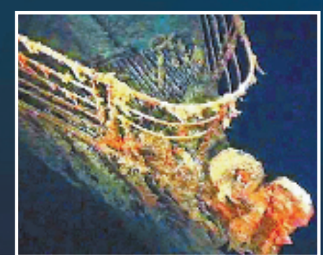
泰坦尼克号残骸(资料图)

本报综合新华社消息 美国海岸警卫队19日说,一艘搭载5人的美国深海潜水器18日下潜考察“泰坦尼克”号邮轮残骸时失联。 考察队日前乘船从加拿大东部出发,前往位于北大西洋的“泰坦尼克”号邮轮沉没水域,18日早上乘“泰坦”号深潜器下潜,但下潜约1小时45分钟后失联。 据报道,这艘名为“泰坦”的潜水器为美国一家私营海底勘探公司所有,最多可载5人。潜水器失踪地点距加拿大东部纽芬兰与拉布拉多省海岸370公里。美国和加拿大