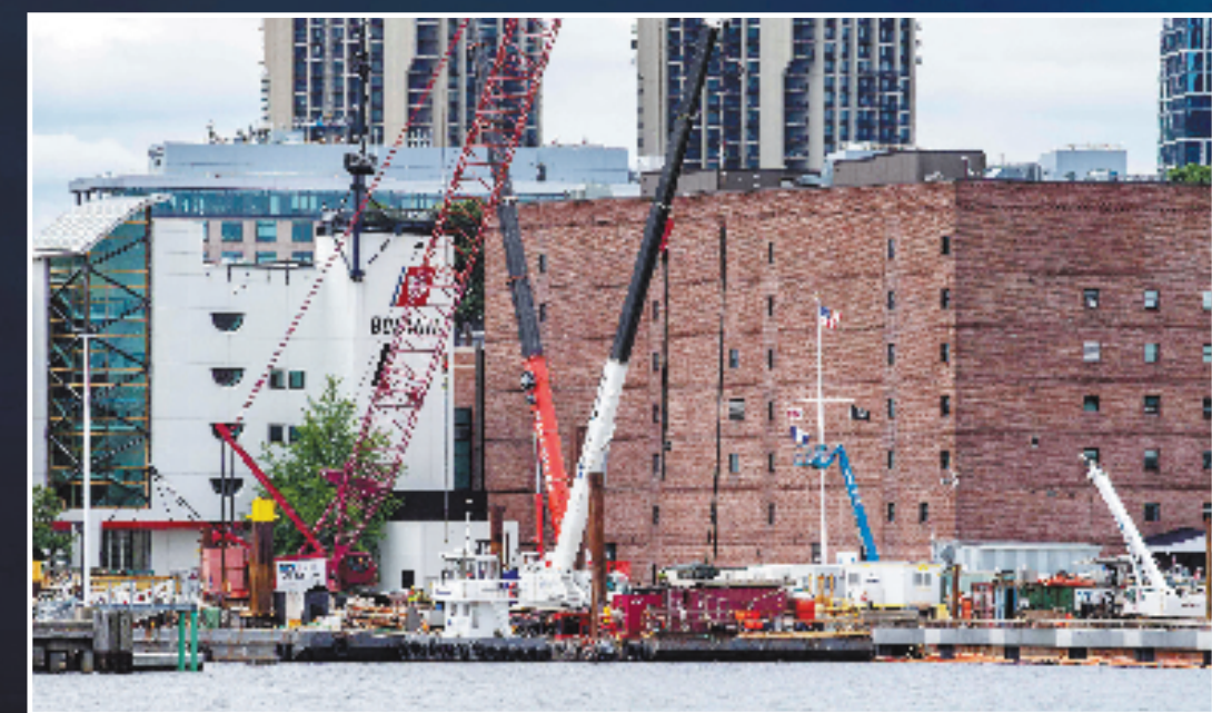
这是6月19日在美国马萨诸塞州波士顿拍摄的海岸警卫队船。部分船只装载设备准备对潜水器“泰坦”展开搜救。