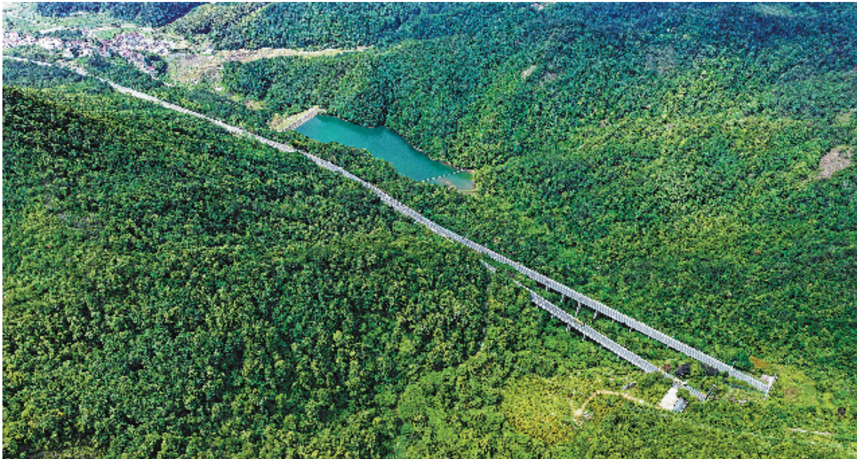
2003年9月18日,时任浙江省委书记习近平同志在浦江下访接访。面对抗坪镇农民代表反映的20省道浦江段改造问题,习近平同志当场拍板,指示改造工程尽快开工建设。700多天后,20省道浦江段全线贯通,昔日崎岖不平的盘山公路变成了平坦宽敞的阳光大道。图为20省道浦江段现状。图为20省道浦江段现状。图为20省道浦江段现状。

江山就是人民,人民就是江山。中国共产党领导人民打江山、守江山,守的是人民的心。治国常,利民为本。为民造福是立党为公、执政为民的本质要求。走过百年奋斗历程的中国共产党在革命性锻造中更加坚强有力,党的政治领导力、思想引领力、群众组织力、社会号召力显著增强,靠的就是党同人民群众始终保持血肉联系。