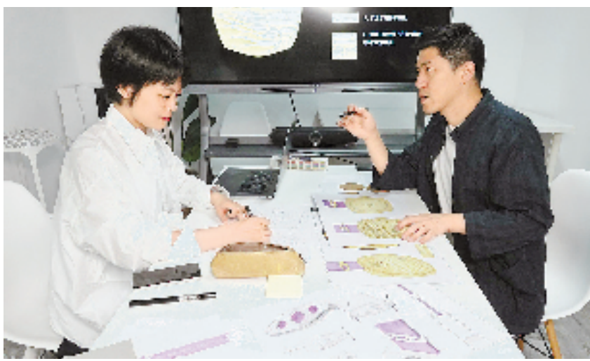
奖牌设计团队在探讨设计方案。

为了找到更多灵感,设计团队跑遍了和良渚文化、西湖文化有关的博物馆。在良渚博物院仔细观看了玉琮、玉