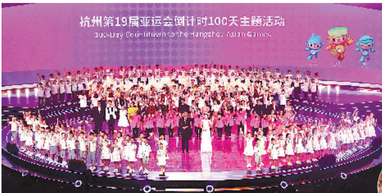
杭州第19届亚运会倒计时100天主题活动举行。