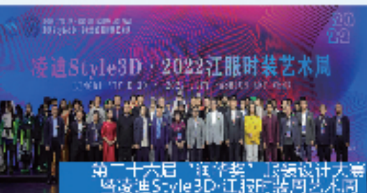
第二十六届“钱学森”杯服装设计大赛 暨凌迪Style3D·江报时尚周艺术周