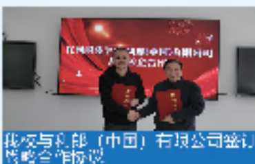
我校与利郎(中国)有限公司签订 战略合作协议