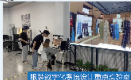
服装数字化系统设计重点实验室