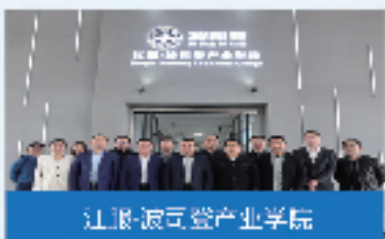
江报-波司登产业学院