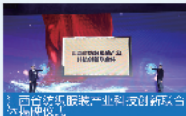
江西省纺织服装产业科技创新联合 品牌颁奖礼